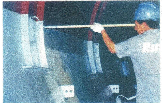
Detalhe de aplicação do revestimento fiberglass/FK na superfície interna de um tanque SG. Plataforma P-37.