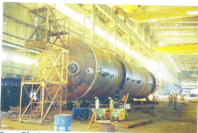
Tanque TO - vista externa - equipamento instalado na P-37, revestido internamente com fiberglass/FK.

Em algumas plataformas, existem os vasos dessalgadores, utilizado no tratamento de água para descarte. Como os índices de cloreto são muito altos, esses equipamentos também são revestidos com plástico reforçado.