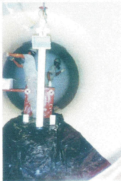
Aplicação de fiberglass 2500 em tanque slop vessel para a plataforma P-19.

Habitualmente, as resinas aplicadas são éster-vinílicas e éster-vinílicas novolac, inclusive vasos com elevada solicitação mecânica – forças abrasivas, como areia e cristais de sal. "No caso de tubulações, também é preferível usar o plástico reforçado. Desembarcamos uma unidade vinda de Cingapura, e as linhas de óleo para carga e descarga do petroleiro eram de material composto", complementa Lamas.